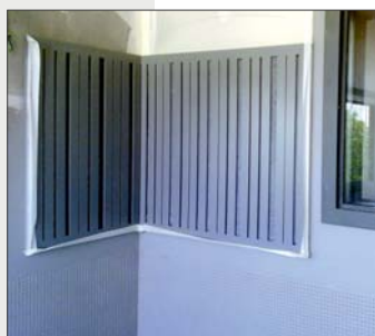
Resonador y friso acústico inferior