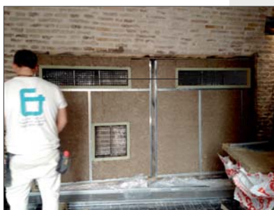
Panel decorativo fonoabsorbente: ejecución (izquierda) y acabado final (derecha)