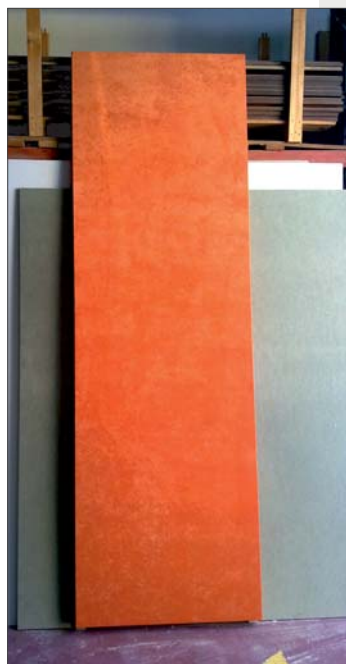
Panel decorativo absorbente

El acondicionamiento acústico de un local o recinto es fundamental para mejorar la calidad y confort acústico de sus usuarios. Si éstos se encuentran cómodos en el interior, a la larga se traduce en mayor beneficio para la actividad.