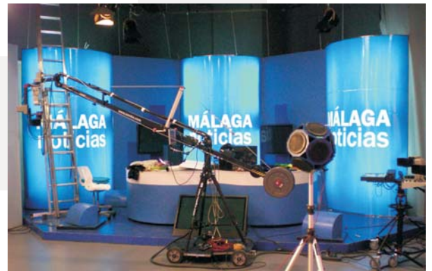
Ensayo de condiciones acústicas en Plató de TV (Málaga).

El informe de ensayo que se entrega consta del establecimiento de los niveles límites aplicables, cálculo de niveles, declaración de conformidad, certificación de producto y valoración de resultados, además de la correspondiente documentación gráfica y acreditaciones de calidad.