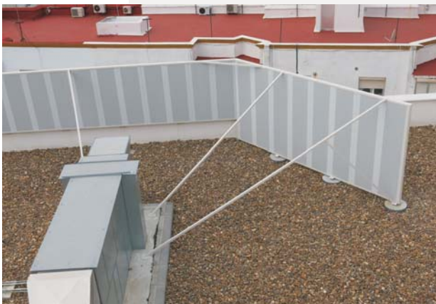
Vista general de pantalla acústica ejecutada por Avandtel.